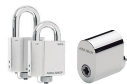
ASSA ABLOY PULSE-lås med teknik för energiutvinning